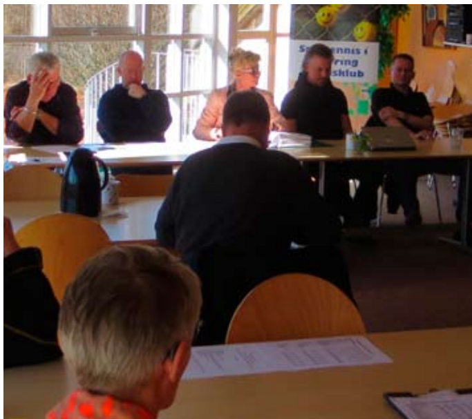
Generalforsamlingens deltagerne er klar til at lytte.