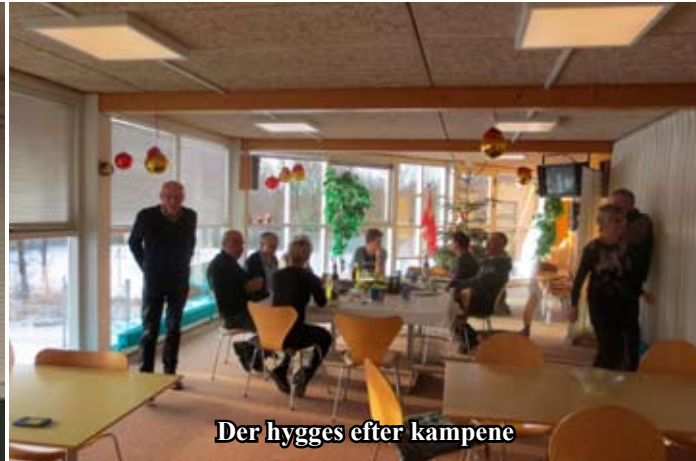
Der hygges efter kampene